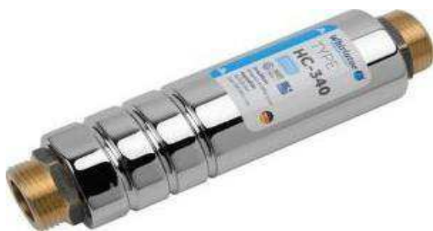
Whirlator HC340 – 940€ttc – Garantie 5 ans