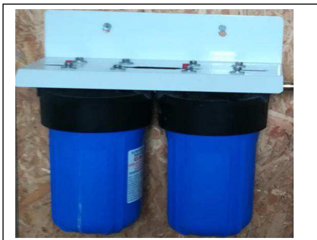
Kit Filtration big blue complet avec filtres – 340 €ttc

Remarquable efficacité sur le calcaire. Mon eau est à 42°TH. J'ai supprimé mon adoucisseur. J'ai installé avant le Whirlator une filtration sédiment 25µ + charbon actif avec 1kg de KDF . Le kit complet est à 1280€ttc port compris.